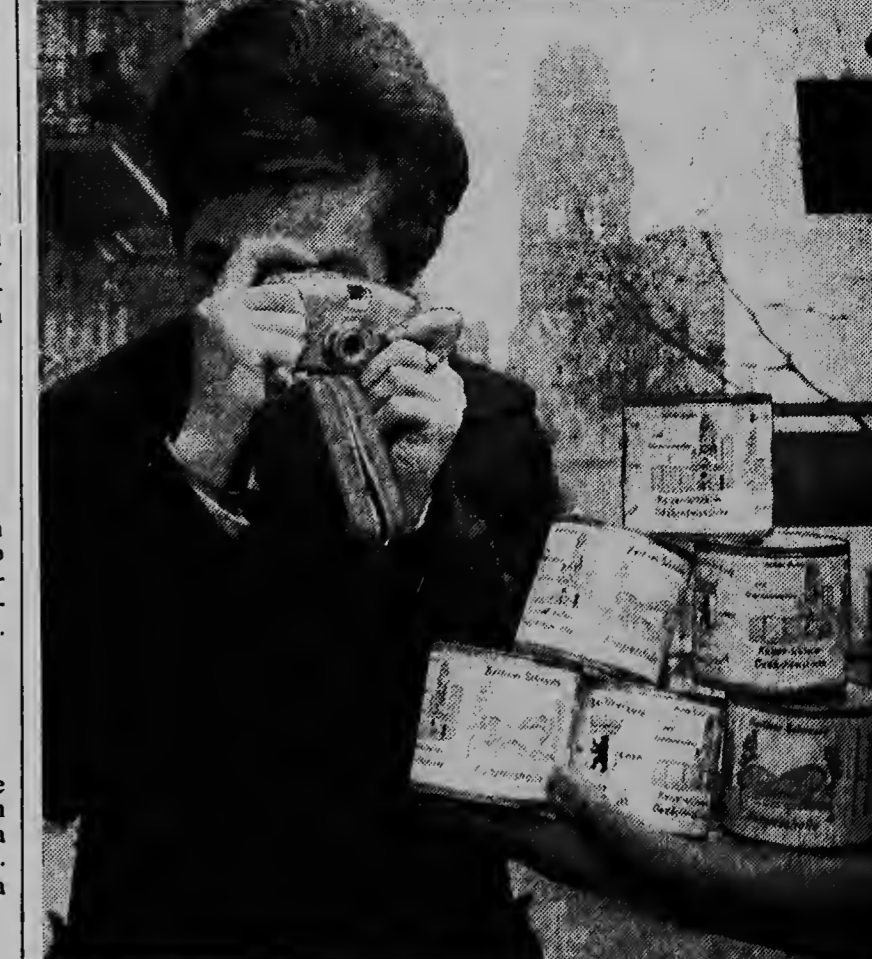
Foi unda tin bez hende sa saca semehante ideanan nos no por bisa, pero wel ta berdad cu e bendedo di corant na Westberlijn a dicidi na bende na bleki manera bleki di lechi; „berdadera aire fresco di Westberlijn". Ta parece cu e tabata hanja hopi cliente denter dje turistanan. Riba etiket dje blekinan nos ta mira portret di e ciudad di West-Berlijn

Tantu e optimistanan na Formosa y e pessimistanan na otro paisnan Azitico ta basa nan speranza riba e posicon di cinco planeta den curso di e siman cu ta hui. Un astrologo prominente di Formosa, Jooan Sjeo San a bisa cu tambe na anja 1524 e planetanan tabata den un posicon igual. Tabata cu e tres anja dje gobernacion di emperador Tsjing Tsjing di Ming Dynasty. Y e pais aki a biba den paz y tabatin hopi progreso.